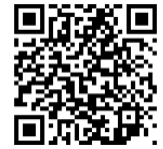
112年金融基礎教育推廣計畫

https://m.ib.gov.tw/Pages/FKLearning_new.aspx?Dir=010400000000000000